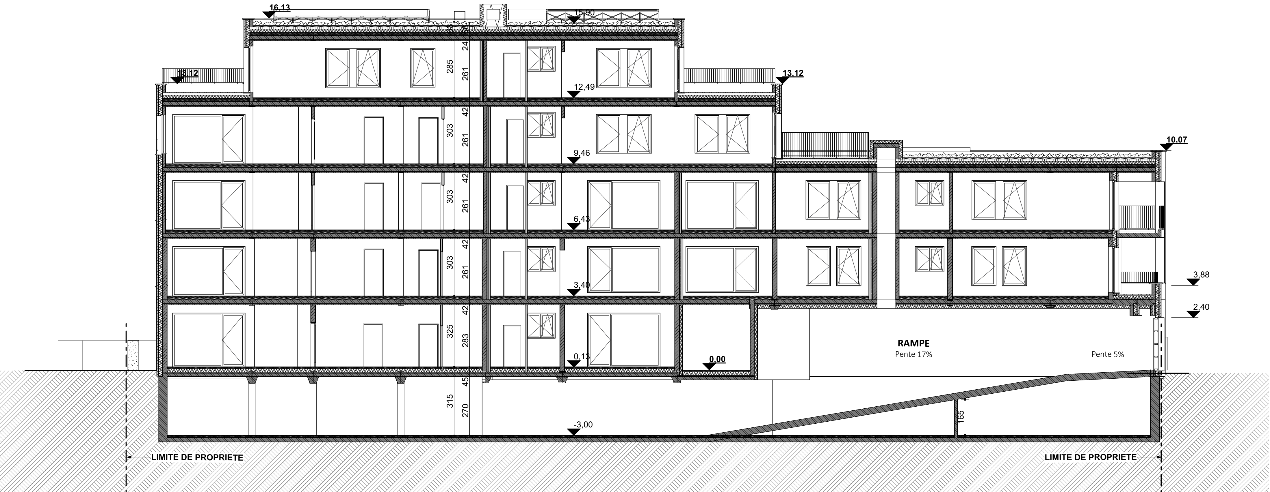
BAT 1 - COUPE DD